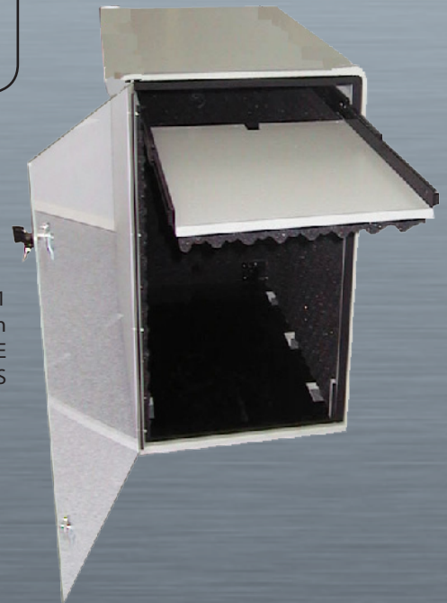
ISS 1 mit Option TASTATUR-ABLAGE und Option SCHLOSS