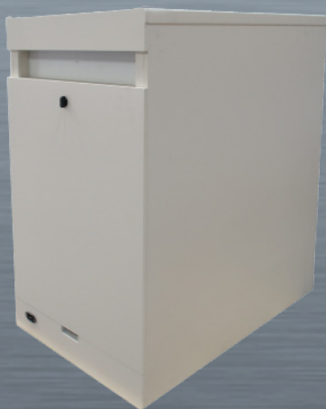
ISS 1: Ansicht der Rückseite