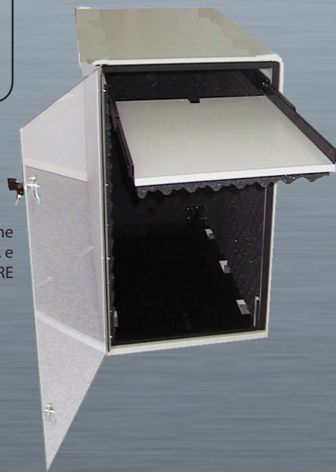
ISS 1 con l'opzione RIPIANO TASTIERA e opzione SERRATURE