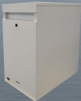
ISS 1 : vista posteriore