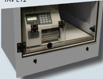
Ausgang Modell TAV L12