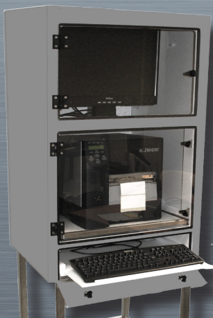
CPI 3 mit ausgezogener Tastaturablage