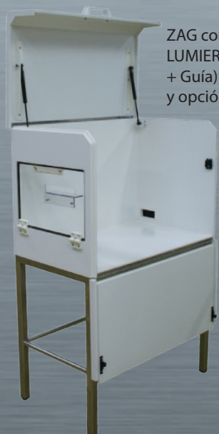
ZAG con opción LUMIERE + GUIDE (Luz + Guía) y opción KDL

Interiores útiles Anc. 420 x F. 720 x H. 520 mm