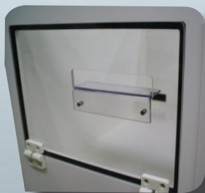
Salida Luz + Guía

Opción SORTIE ÉTIQUETTES Salida de etiquetas