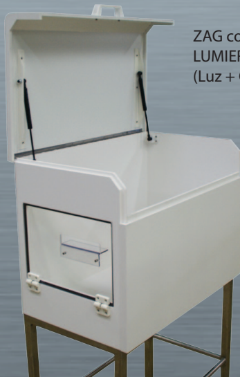
ZAG con opción LUMIERE + GUIDE (Luz + Guía)